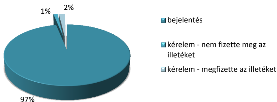
A bejelentések és kérelmek aránya az összes panasz számához viszonyítva 2014-ben

A sérelmezett és a Hatósághoz bejelentett elektronikus hirdetések küldésének módját tekintve az SMS útján továbbított elektronikus hirdetések aránya 2014-ben az előző évihez képest nem változott, még mindig jelentősen alatta marad - nyilvánvalóan költségvonzata miatt - az e-mailben küldött és panaszolt kéretlen e-hirdetések számának. Egyéb, az elektronikus levelezéssel egyenértékű, vonatkozó szabályozás hatálya alá tartozó más egyéni kommunikációs eszköz (pl. fax, MMS) útján továbbított üzenettel kapcsolatosan 2014-ben panasz a Hatósághoz nem érkezett.